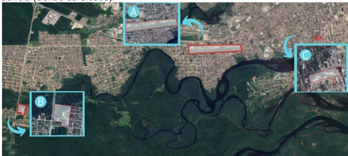
FIGURA 2: Localização das três áreas de coleta, sendo: A - Aeroparque (Parque urbano); B - Fragmento florestal (Área de Reserva Legal) IFPR; C - Praça Eufrázio Correia (Centro da Cidade).