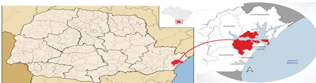
FIGURA 1: Localização do município de Paranaguá - PR.

O estudo foi realizado em Paranaguá (Figura 1), que possui uma área territorial de 822,838 km 2 para uma população de 145.829 habitantes (IBGE, 2023). O município está localizado dentro de uma grande faixa de Mata Atlântica, sendo este o segundo maior bioma florestal brasileiro. A região apresenta clima predominante subtropical úmido (Cfa), com chuvas em todas as estações, inverno levemente seco, verão úmido e massas tropicais instáveis (NITSCHKE et al. , 2019).