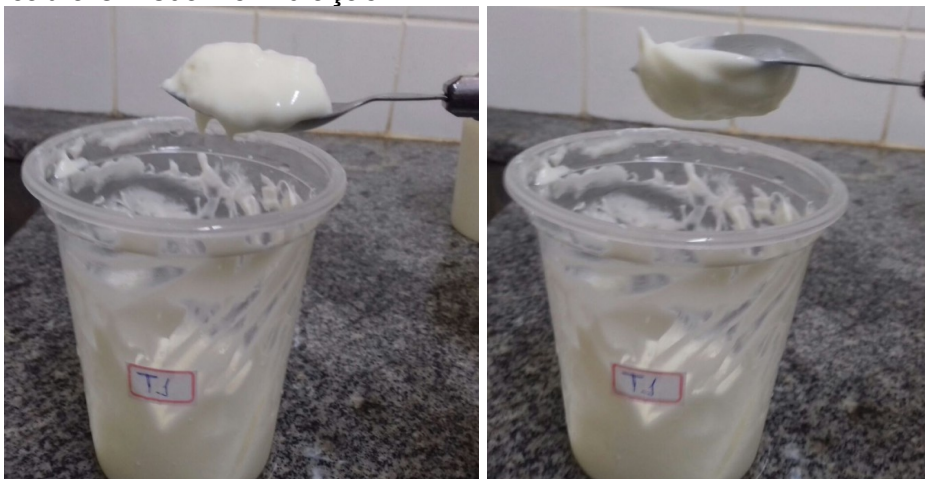
FIGURA 2. Textura e aderência do Labneh a base de leite de cabra em sua Formulação T1

Para a avaliação da textura e cremosidade do Labneh a base de leite de cabra, foi utilizado um método prático, com uso de uma colher de sopa. Esse teste compreende em virar uma colher contendo Labneh e verificar a fixação na mesma. O Labneh que não se desprender da colher, se encontra no ponto ideal. O teste de cada tratamento está demonstrado nas Figuras 2, 3, 4,5 e 6.