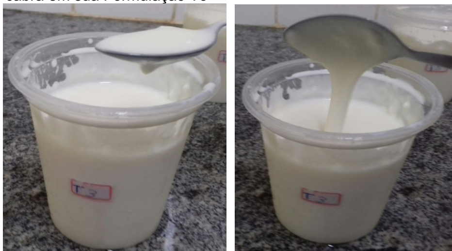
FIGURA 4. Textura e aderência do Labneh a base de leite de cabra em sua Formulação T3