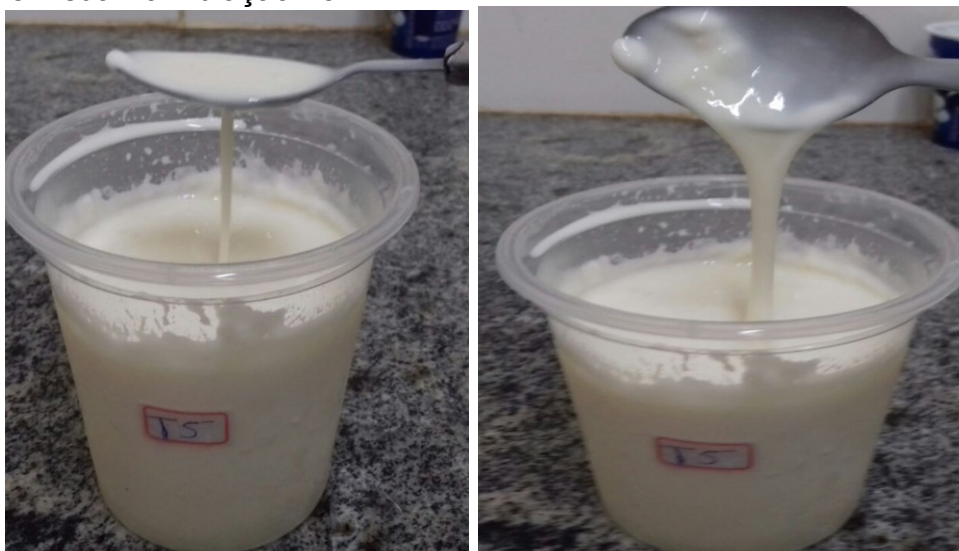
FIGURA 6. Textura e aderência do Labneh a base de leite de cabra em sua Formulação T5.