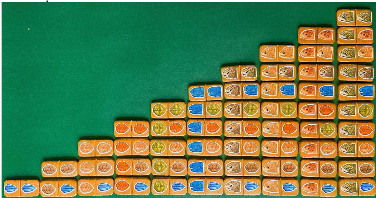
FIGURA 3 – Jogo didático utilizado na proposta educativa desenvolvida no Trabalho de Formação Docente.