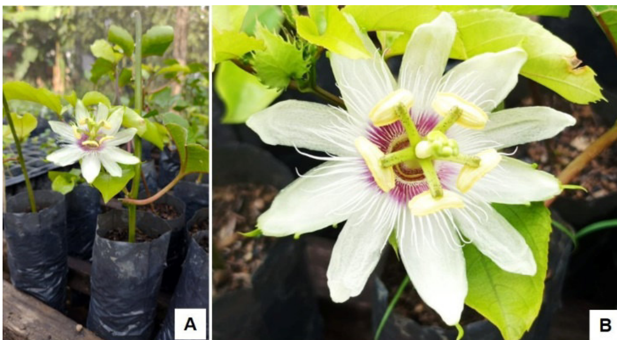
FIGURA 4 - Exploração da idade ontogenética da planta, mudas ainda desenvolvimento inicial já exibindo flor em antese: A - Muda com flor; B - Flor em antese e botão floral ao fundo.

A presença de botões florais e flores em antese, ainda em estágio inicial de desenvolvimento da planta a campo foi considerada normal, pois as estacas foram retiradas de matrizes já em estágio reprodutivo visando acelerar o tempo para início da produção. Até mesmo durante os 60 dias de preparo da muda, foi possível observar a presença de flores em antese (Figura 4). Dentro da Biologia isso é considerado como exploração da idade ontogenética da planta, que se refere ao uso de material biológico com idade genética avançada, que já passou por sucessivas fases do desenvolvimento. Ao produzir uma muda com o material nessa fase, ela já se desenvolverá em estágio reprodutivo.