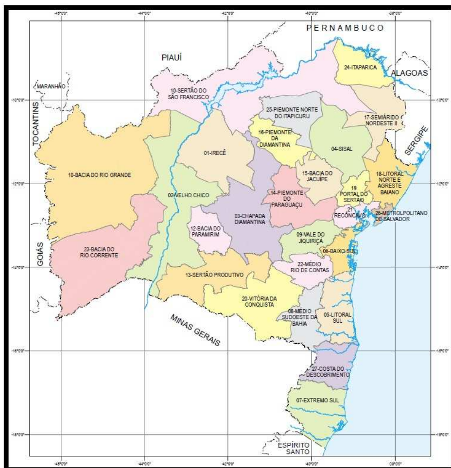
FIGURA 1. Mapa da Bahia com seus 27 Territórios de Identidade, incluindo Sudoeste Baiano (Vitória da Conquista).

O Território de Identidade Sudoeste Baiano, antigo Vitória da Conquista, inserido na macrorregião Semiárido, compreende uma área de 27.275,6 km 2 , equivalente a 4,7% do território do estado, englobando 24 municípios (Figura 2) (BARRETO, 2014). O Território possui uma população estimada, segundo dados de 2010, de 695 mil habitantes, com destaque para o Município de Vitória da Conquista, com população estimada em 306 mil habitantes e com Produto Interno Bruto de R$ 3,8 bilhões segundo IBGE, em 2013 (IBGE, 2016). No agronegócio regional, há destaque para as culturas agrícolas do café, algodão, maracujá, banana e também as culturas de subsistência como feijão, milho, mandioca etc. É importante considerar que a atividade pecuária se destaca com aproximadamente 70% de toda a área de cobertura vegetal do Planalto da Conquista (NOVAES et al., 2008).