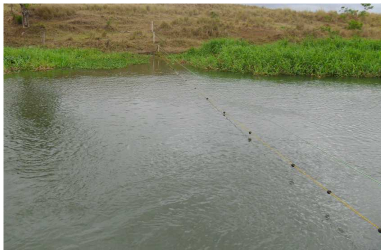
FIGURA 2. Seção transversal de coleta das amostras no rio Catolé

Para avaliação das variáveis de qualidade da água em diferentes vazões do rio, as coletas das amostras foram realizadas em quatro épocas distintas. As coletas ocorreram nos dias 15/05/2010, 07/08/2010, 12/11/2010 e 06/02/2011. Em cada amostra coletada foram quantificadas as variáveis: oxigênio dissolvido (OD), nitrato, fósforo total, pH, condutividade elétrica (CE) e turbidez.