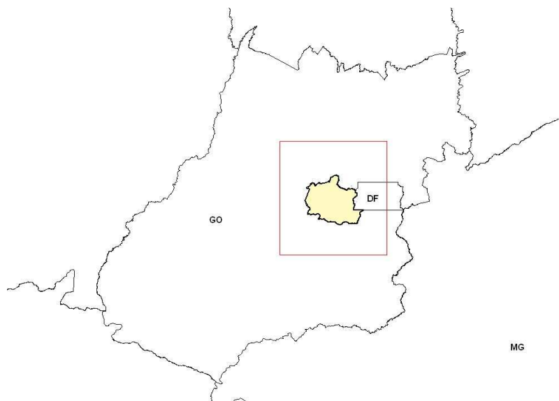
FIGURA 1. Localização do EcoMuseu do Cerrado.