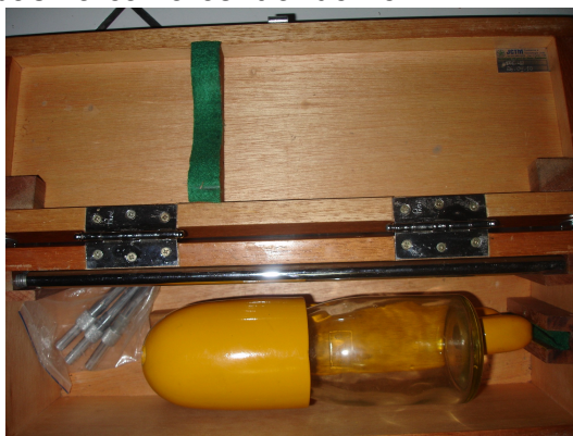
FIGURA 1. Amostrador de sedimentos.

Nos meses de maio, junho, julho, agosto e setembro procederam-se as coletas de água, nas quais dois tipos de amostragem para comparação foram adotados: amostragem realizada de 0-20 cm de profundidade e amostragem por integração vertical, sendo esta última realizada com o auxílio de um amostrador de sedimentos (Figura 1), ambas na calha central do rio.