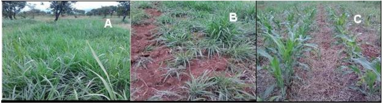
FIGURA 1. Parcelas experimentais de capim-maradú submetido a sistemas de manejo de recuperação química (A), recuperação com o uso de grade associado a recuperação química (B) e pelo sistema de plantio direto (C) no cerrado matogrossense.

A recomendação de calagem e adubação foi realizada com base na análise química do solo, de acordo com Sousa et al. (2002). A calagem foi realizada a lanço após o rebaixamento da pastagem (Figura 1). A saturação por bases foi elevada para 50%. Na adubação foram utilizados 200 \text{ kg ha}^{-1} de N na forma de Uréia, 50 \text{ kg ha}^{-1} de \text{P}_2\text{O}_5 na forma de superfosfato simples e 40 \text{ kg ha}^{-1} \text{K}_2\text{O} na forma de cloreto de potássio, distribuídos uniformemente a lanço, para todos os tratamentos. A correção do solo se deu pela aplicação do calcário a lanço. O adubo foi distribuído a lanço pela parcela, logo após o rebaixamento da pastagem altura de 10 cm da superfície do solo.