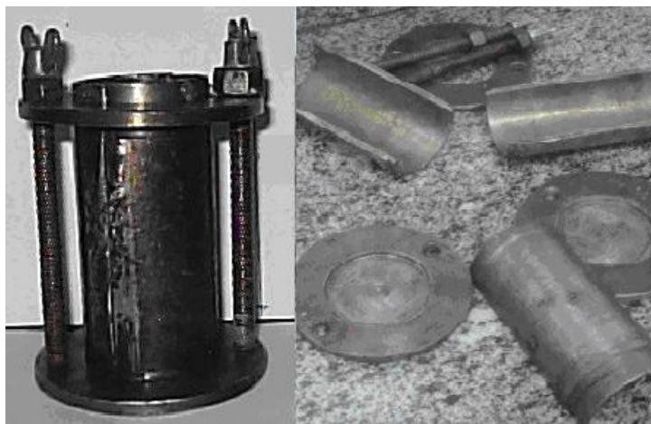
FIGURA 02 - Molde de prova 9,0 cm x 4,5 cm.

horas, este processo além de demorado permitia a ocorrência de trincas e perfurações no interior do corpo de prova, favorecido pelas retrações devido ao resfriamento natural.