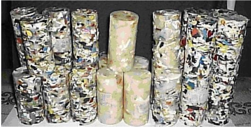
FIGURA 03 – Corpos de prova após serem torneados.

Na metodologia utilizada de resfriamento com choque térmico e retirada do material com choque físico, decorreram danos mecânicos no processo e conseqüente penetração de água em alguns poros do corpo de prova. Devido aos defeitos técnicos na regulagem da mufla do Laboratório de Química que gerou atraso na confecção do material este impediu o a moldagem dos polímeros termoplásticos em forma de telhas e tijolos para a análise de teste mecânico e análise de ambiente.