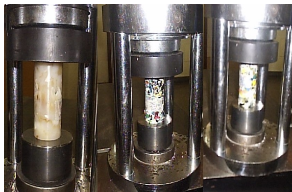
FIGURA 04 – Da esquerda para direita, ruptura do CP- 04 (100 % PEAD), CP-02 (100 % PP) e CP-01(50 % PEAD / 50 % PP), na prensa hidráulica do Laboratório de Furnas.

A preparação dos corpos de prova com 75% PP e 25% PEAD, foram descartados após as duas primeiras confecções, sendo que o PEAD teve rápida homogeneização do material, não aderindo com o PP, causando trincas nos corpos de prova.