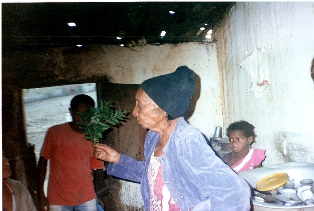
FIGURA 2. REZA NO INTERIOR DO QUILOMBO