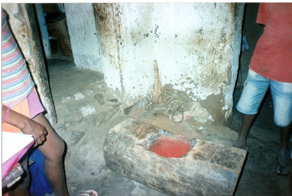
FIGURA 1. CULTURA MATERIAL NO QUILOMBO DO BOQUERÃO Autora: Romilda Assunção / 2009

A cultura material faz parte do cotidiano dos quilombolas como pode ser vista na imagem 1. Assim, dona Silvina, quilombola do Boqueirão, ainda relata: “O pilão serve para pisar café, corante, canjica, aquele dali mesmo é véi, foi dos mais véi daqui. Ali na casa de minha tia tem um pilozão grandão que foi do tempo do meu avô já tem mais de 100 anos”.