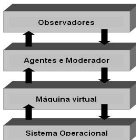
FIGURA 3 – Diferentes camadas do sistema implementado neste trabalho

Uma variável do sistema é comparada com \beta . Se for superior, a simulação termina. Se não, um novo período é iniciado. Ao final, os observadores mostram um retrato global da simulação, bem como os detalhes do que aconteceu com cada agente em cada período.