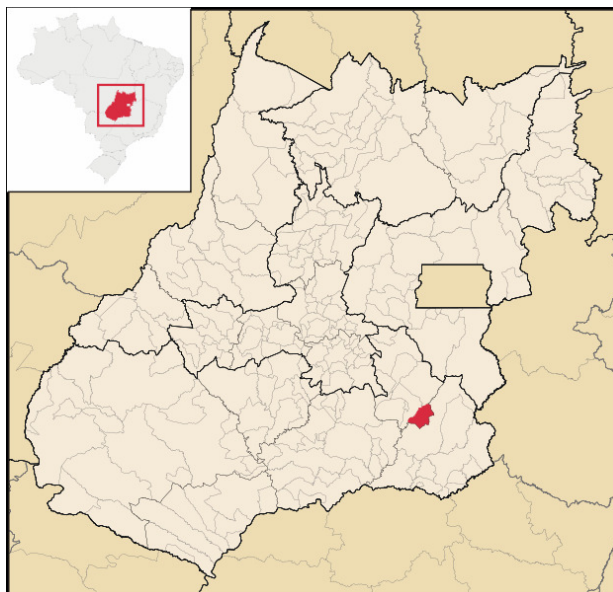
FIGURA 1 – Mapa do município de Urutaí

O depósito de resíduos sólidos a céu aberto (lixão) do município de urutaí – GO localiza-se a cerca de três Km da cidade de Urutaí (Figura 2) e possui um área aproximada de 3,0 ha. A estrada que dá acesso ao depósito é a mesma que liga a cidade de Urutaí a rodovia GO-020, passando pelo ribeirão “Geraldo Vítor”, importante curso d’água da microbacia hidrográfica do Rio Corumbá.