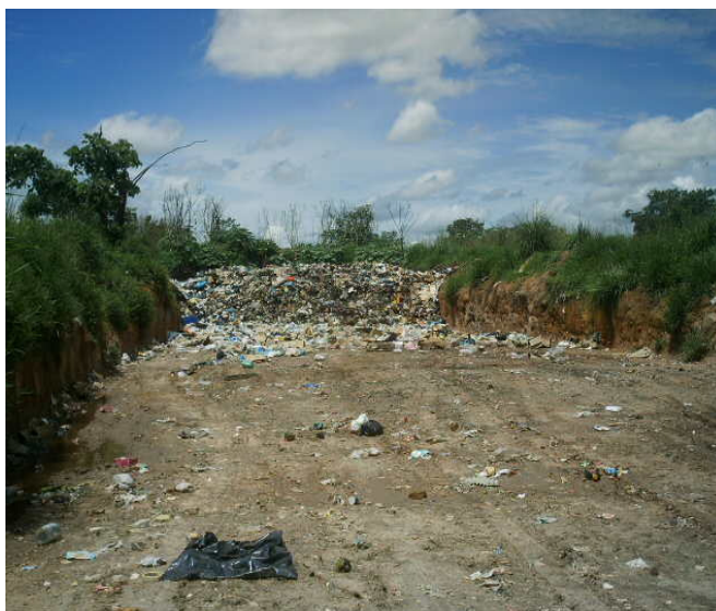
FIGURA 3 – Imagem frontal da vala de disposição.

A área do lixão não possui nenhum tipo de impermeabilização, logo é comum observar acúmulo de água das chuvas em vários locais ao longo do perímetro. Outro importante fator a ser mencionado é que existem no local um grande número de materiais com alto potencial de reciclagem, dentre estes destacam-se o alumínio e o pet.