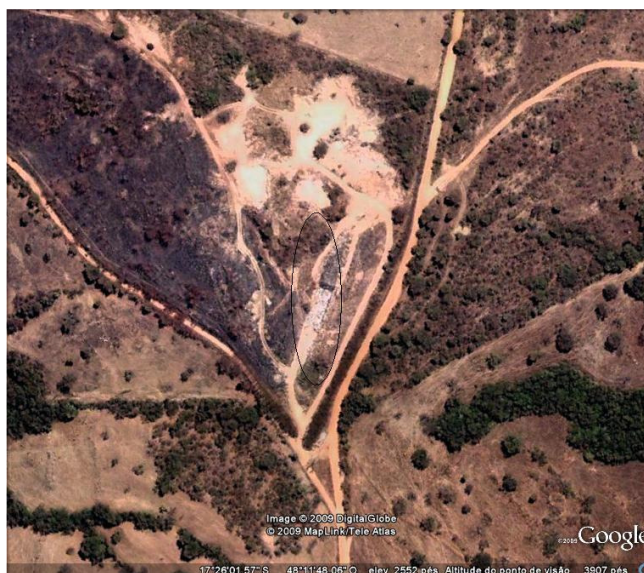
FIGURA 2 – Imagem aérea da área de estudo. Fonte: Google Earth, 2009.

O depósito de resíduos sólidos a céu aberto (lixão) do município de urutaí – GO localiza-se a cerca de três Km da cidade de Urutaí (Figura 2) e possui um área aproximada de 3,0 ha. A estrada que dá acesso ao depósito é a mesma que liga a cidade de Urutaí a rodovia GO-020, passando pelo ribeirão “Geraldo Vítor”, importante curso d’água da microbacia hidrográfica do Rio Corumbá.