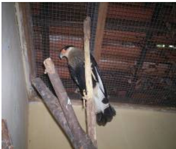
FIGURA 2. O Falconiforme carcará ( Polyborus planctus ) do Parque Municipal da Matinha, Itapetinga, BA, espécie proveniente do tráfico.

Conforme MARINI & GARCIA (2005), a perda, a degradação, a fragmentação de habitats e a caça, especialmente para o comércio ilegal, são ameaças às aves brasileiras.