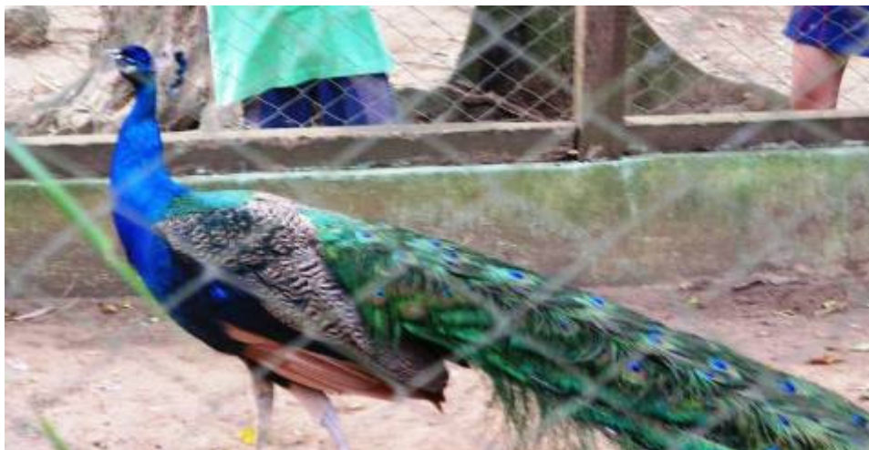
FIGURA 4. Exemplar do Galliformes pavão ( Pavo cristatus ), espécie exótica do Parque Municipal da Matinha, Itapetinga, BA.

Dentre as aves encontradas no parque, apenas o Galliforme pavão ( Pavo cristatus ) é pertencente à fauna exótica (Figura 4).