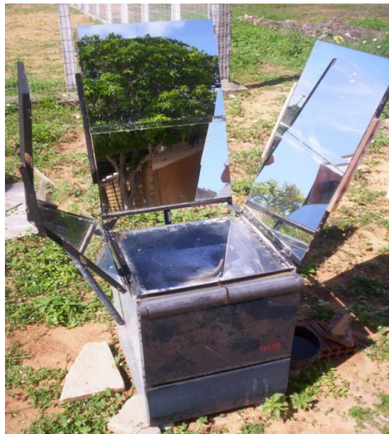
Figura 1. Fogão solar tipo caixa de baixo custo do Laboratório de Maquinas Hidráulicas e Energia Solar da UFRN/LMHES.

O uso do fogão solar proposto da Fig.1 tem grande importância também na área ambiental, pois preserva a natureza e ameniza o desequilíbrio ecológico que ocorreria pelo uso indiscriminado da lenha, além de minimizar a emissão de gases poluentes para a atmosfera. Como se pode ver, estudos que viabilizem o uso do fogão solar são imprescindíveis para uma política de fixação do homem no campo, podendo dar-lhe uma opção de geração de renda, através do domínio da construção de fogões solares, para sua futura comercialização (Moura, 2007).