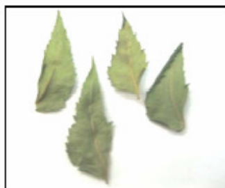
Folhas do Nim inteiras.