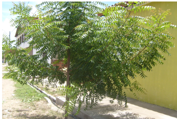
Planta jovem de Nim em frente às casas da comunidade de Maracanaú.