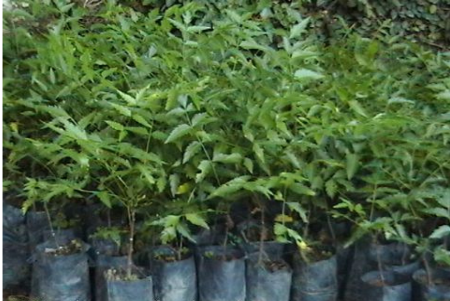
Mudas de Nim na Estufa do Colégio Estadual Liceu de Maracanaú.