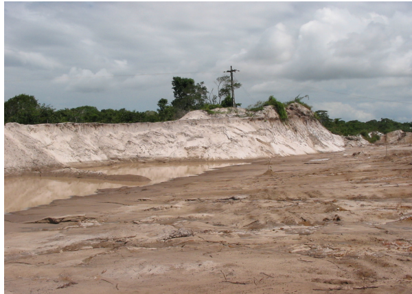
Figura 4 - Área degradada pela retirada de areia – NUPPA/UFPB

Na bacia do Rio Cabelo, o método mineração por escavação, é responsável por cerca de 100 % de toda a areia extraída na região. Evidentemente, as principais conseqüências desse procedimento estão relacionadas com a perda de solo, a erosão do material de decapagem quando estocados de forma inadequada, a erosão da frente da lavra e o abandono de grandes cavas ao término da atividade, impedindo o uso futuro do solo e gerando criadouros de causadores de doenças e incômodos à população (Vale Verde – Associação de Defesa do Meio Ambiente, 2004).