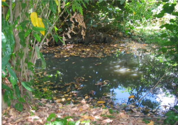
Figura 3 - Foto do lago de águas residuais com aspecto de esgoto doméstico, em área do Complexo Penal de Mangabeira

instaladas no distrito industrial de Mangabeira, tubulação da Estação de Tratamento de Esgoto de Mangabeira que quando apresentam vazamento contaminam o rio diretamente com esgotos sem tratamento, instalação de criação de suínos e bovinos que contribuem para contaminação do rio com os seus efluentes sem tratamento preliminar adequado.