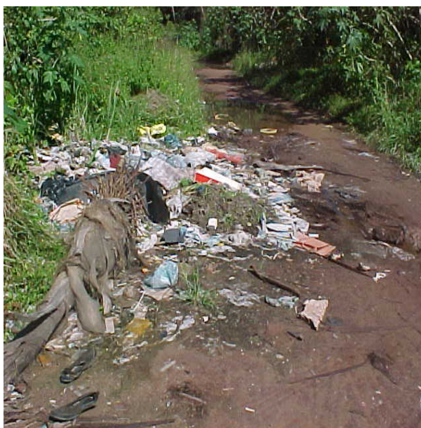
Figura 2 - Resíduos sólidos lançados diretamente na mata

Salienta-se que mesmo com coleta sistemática dos resíduos nas residências próximas a nascente do rio nas proximidades do Conjunto Cidade Verde, área mais urbanizada, alguns moradores depositam seus resíduos diretamente no solo e mais impactante dentro da vegetação nativa, contribuindo para degradação ambiental. No trecho da bacia que é utilizado como balneário (escadaria da Penha), foram identificados diversos resíduos deixados pelos banhistas no leito do rio. Não existe nem um trabalho de educação ambiental na área, apesar ser utilizada como balneário e da proximidade com estuário da Penha, ponto turístico de João Pessoa.