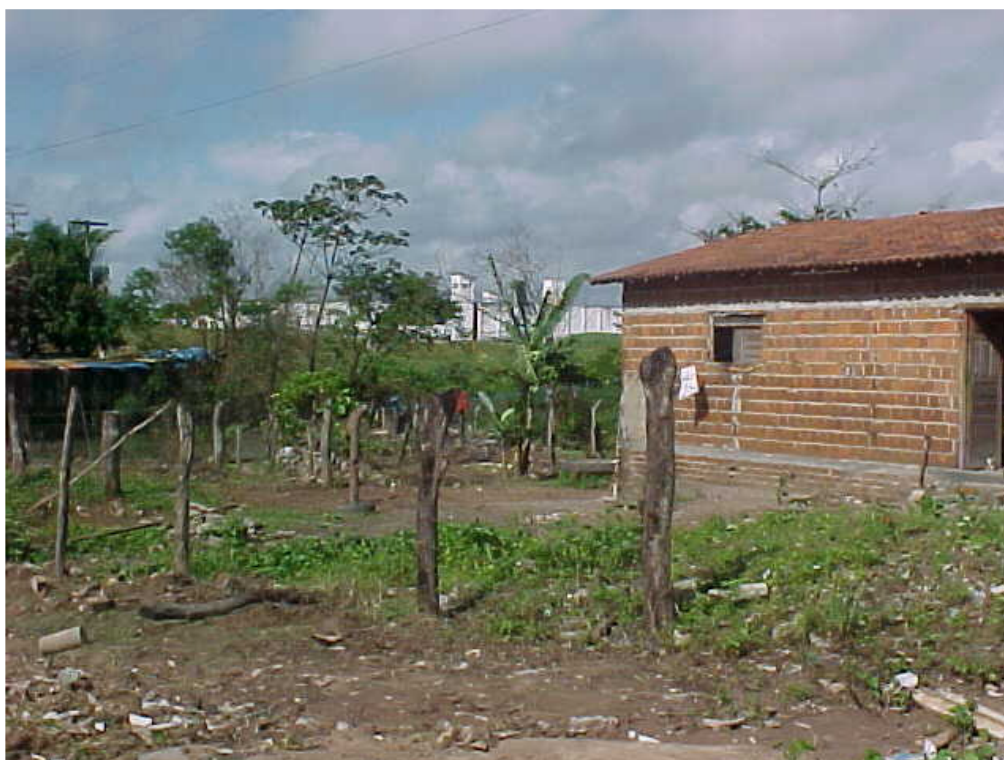
Figura 4 – Área de ocupação as margens do Rio Cabelo

Diversos tipos de ocupação irregular foram observados na bacia do Rio Cabelo, expansão urbana sem infra-estrutura (Figura 4), e sem considerar restrições ambientais, entre elas residências (barracas, granjas os esgotos são lançados a montante da nascente sem nenhum tratamento, provocando diversos problemas ambientais, tais como: degradação e assoreamento do rio, aumento da poluição da água.