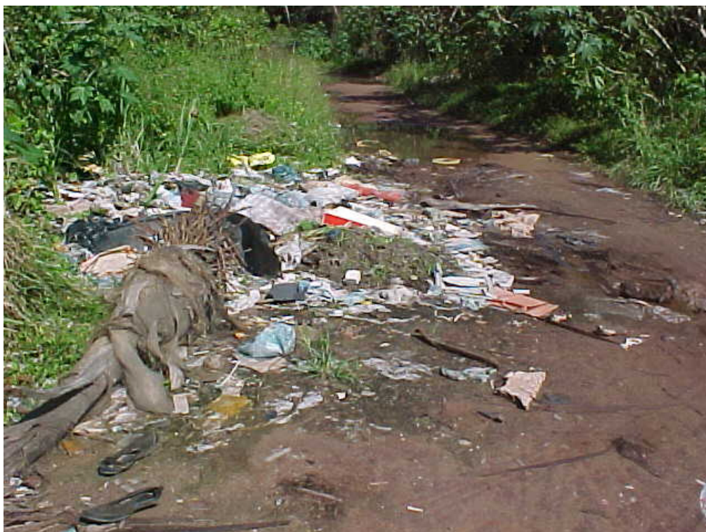
Figura 3. Resíduos sólidos lançados diretamente na Mata Atlântica

A situação da disposição final dos resíduos sólidos é extremamente grave se forem consideradas as condições e os efeitos dessa disposição (Vale Verde – Associação de Defesa do Meio Ambiente, 2004). Talvez o mais relevante problema esteja relacionado ao favorecimento de infiltrações e contaminações do lençol freático quando da liberação de chorume. O chorume é um líquido escuro contendo alta carga poluidora, o que pode ocasionar diversos efeitos sobre o meio ambiente. O potencial de impacto deste efluente está relacionado com a alta concentração de matéria orgânica, reduzida biodegradabilidade, presença de metais pesados e de substâncias recalcitrantes.