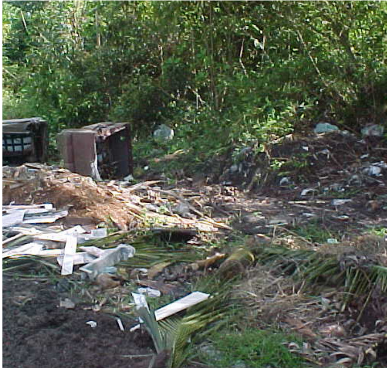
Figura 5 – Presença de resíduos sólidos lançados na Mata.