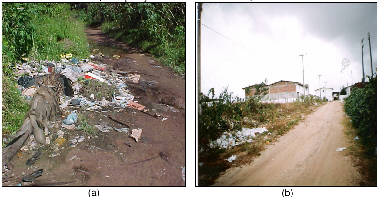
Figura 2. Resíduos sólidos na bacia do Rio Cabelo, próximo a Mata (a) e a área do distrito industrial de Mangabeira (b).

A bacia hidrográfica do Rio Cabelo vem sofrendo diversos tipos de agressões ambientais dentre elas, a disposição dos resíduos sólidos, formando verdadeiros lixões